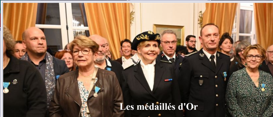
Les médaillés d'Or