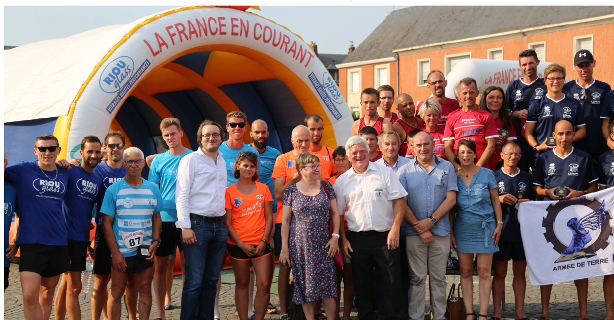
Etape de Gisors

Magnifique parcours pour cette nouvelle édition de la course pour commémorer le centenaire de la Grande Guerre, le départ fut donné à Douaumont. Neuf équipes au départ dont des fidèles, Courir pour Curie, le Conseil Départemental de l'Eure, une équipe de l'Armée de terre et bien d'autres. Comme il est prévu dans le règlement, une féminine au moins par équipe.