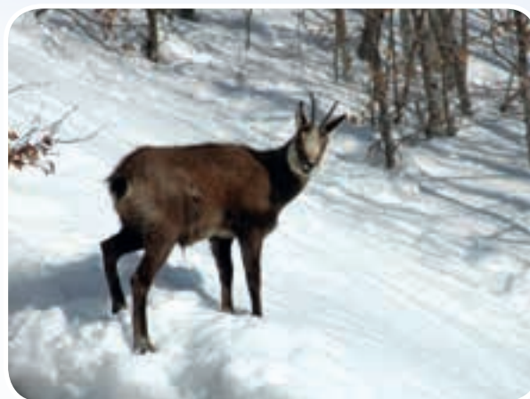
Dès la première semaine c'est le bonheur...