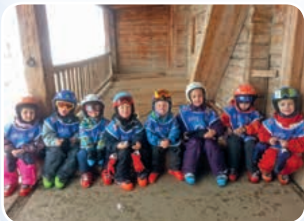
« Petite pause goûte devant le chalet d'alpage »

Alors, dès 3 ans, les Ecoles de Ski ont organisé l'accueil des enfants, dans des structures d'accueil et des jardins des neiges ludiques, avec figurines, tapis roulants, apprentissage de la glisse, contact avec la neige. Les moniteurs et monitrices se sont spécialisés pour offrir une approche par le jeu, la découverte et le plaisir.