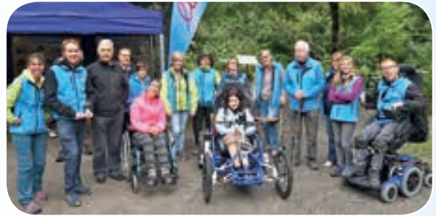
Une équipe formidable : LIVE Haute-Savoie, dont les deux responsables ont reçu la Médaille de Bronze de la Jeunesse, des Sports et de l'Engagement Associatif en 2015