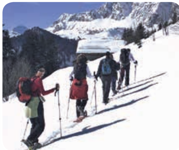
La raquette à neige connaît un grand succès. C'est une activité de découverte douce de la montagne, qui a été relancée dès 1977 par les Accompagnateurs en montagne de Haute-Savoie.

Le ski et toutes les activités proposées dans les stations, permettent aujourd'hui à chacun de choisir sa destination en fonction de ses envies, de ses capacités, de son temps disponible, de ses moyens. La montagne, dans sa globalité est un environnement exceptionnel dont les bienfaits se répercutent tout au long de l'année. Le plaisir doit être le mot essentiel qui motive chaque vacancier.