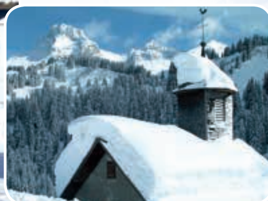
Il est où le bonheur ? Au-dessus des nuages ?