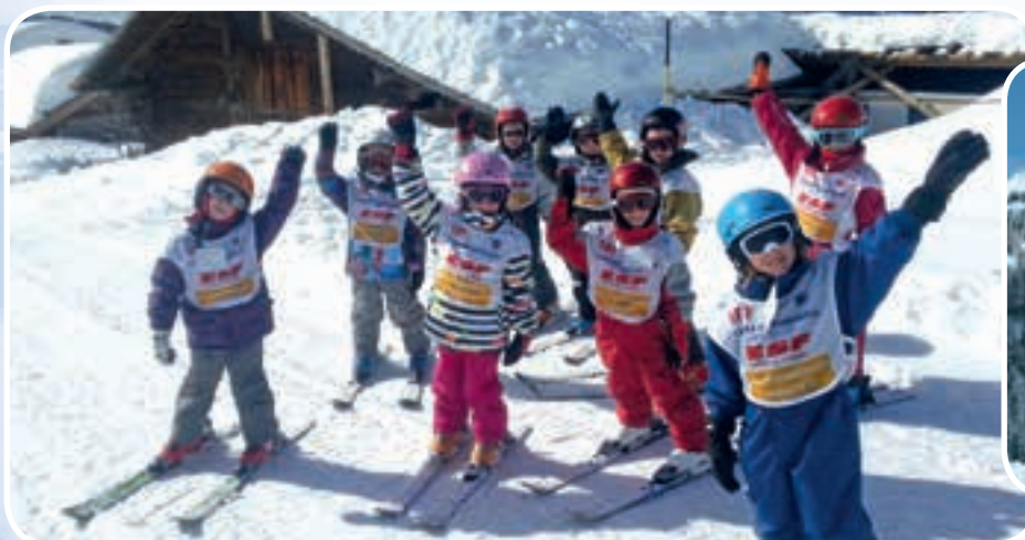
... on découvre la montagne, la neige, les traces d'animaux, les sapins enneigés !