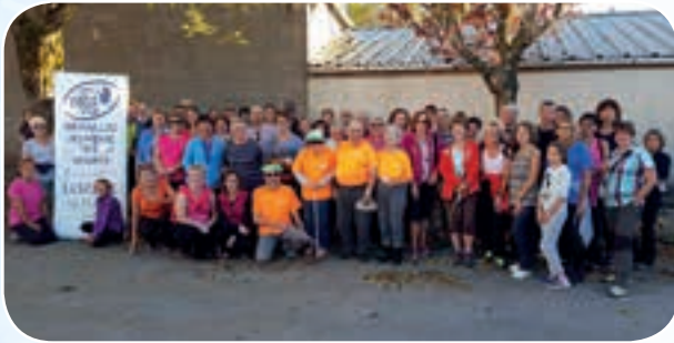
Plein d'espoirs pour cette première organisée par le comité de la Lozère, déjà beaucoup de participants.