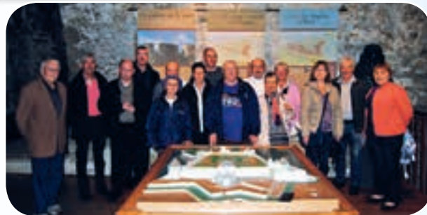
Une partie des participants à l'écoute de notre guide.