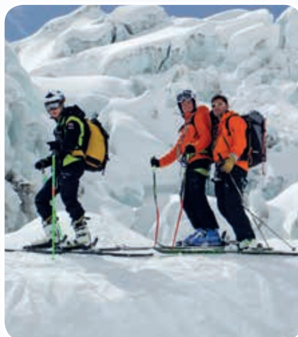
La Vallée Blanche pour les skieurs avertis ou encadrés par un guide.

La maîtrise de la technique et le matériel moderne facilitent la pratique du ski qui peut se décliner jusque sur les pentes de la Haute-Montagne.