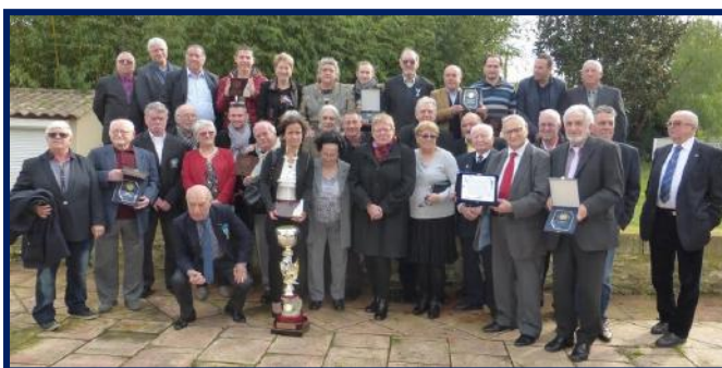
2016 – Dernière AG régionale Languedoc-Roussillon, le 23 janvier 2016, à Nîmes.

Retrouvez les actualités de la Fédération française des Médailleurs de la Jeunesse, des Sports et de l'Engagement Associatif sur le site internet : http://ffmjs.fr/ .