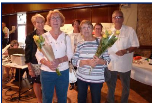
Tournoi de bridge, remise de bouquets, en septembre.