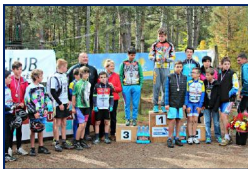
Vétathlon de Mende, remise des prix, en octobre.

Participation au Téléthon à Hyper U Mende, avec remise de diplômes du Bénévolat.