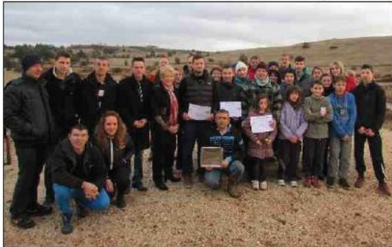
■ Un trophée pour le club et des diplômes pour les éducateurs.