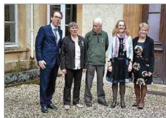
■ La médaille d'or couronne l'engagement d'une vie de bénévole.