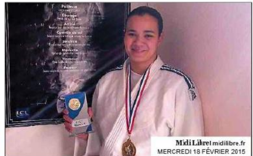
Midi Libre | midilibre.fr MERCREDI 18 FÉVRIER 2015