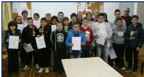
Challenge des écoles de tir à Saint-Chély-d'Apcher, en avril.