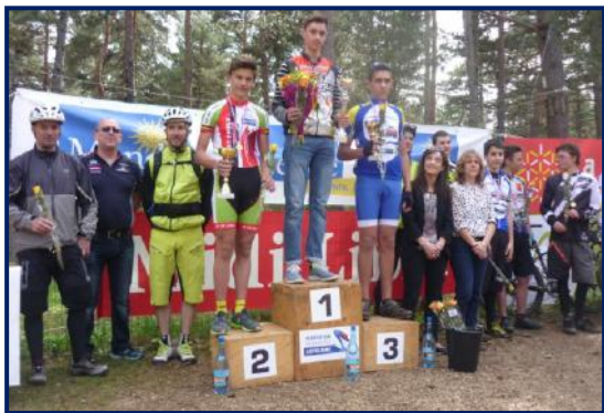
Remise du Challenge Cross country, organisé par le Vélo club Mende Lozère, sur le Causse de Mende, en mars.