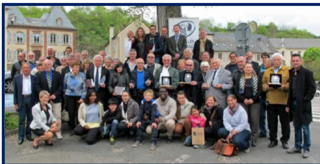
2015 - AG régionale Languedoc-Roussillon, le 28 avril 2015, à La Canourgue.