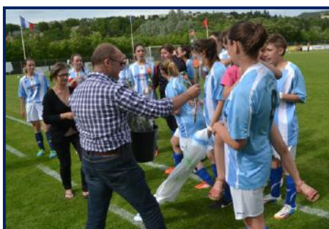
Coupe Lozère féminine, remise de roses aux équipes, en mai.