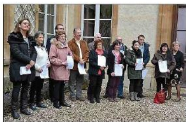
■ Avant la médaille, une lettre de félicitations est remise.