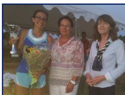
Montée de la Croix neuve, remise des prix, en juillet.